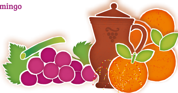
Feira de Sant'Iago 2019 - Programa